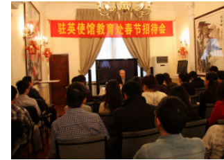
左图：2012年驻英国使馆教育处举办新春招待会。