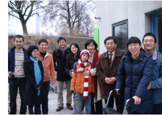
下图：驻加拿大使馆教育处教育公参春节看望加东2省我留学人员。