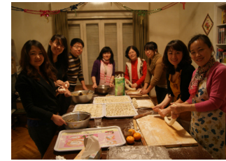
上图：驻日本使馆教育处举行中国留学生学友干部新年联欢会。